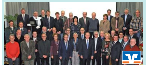
Gemeinsam für die Heimatforschung und Heimatpflege: Stiftungsbeirat und Vereinsvertreter der geförderten Institutionen bei der Übergabe der Fördermittel vor dem Bürgerhaus Wemb

Die größte Fördersumme erhielt in diesem Jahr mit 2.500 Euro der Förderverein Steprather Mühle Walbeck für die Erhaltung der Funktion der Mühle und die Erneuerung des Flügelkreuzes. 1.500 Euro erhält der Historische Verein für Geldern und Umgegend zur Förderung des „Geldrischen Heimatkalenders“.