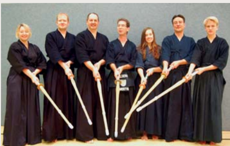
Bestanden ihre Prüfungen: Die Kendo-Sportler vom Budosport Gelderland.